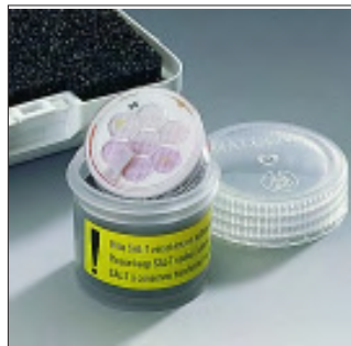
Single SAL-T-Humidity checks 11%, 33%, 53%, 75%, 90%, 98% RH

Bitte auch die Salz-Sicherheitsdatenblätter konsultieren, die jedem Salz beiliegen.