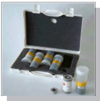
5 x SAL-SC-Humidity check set 11%, 33%, 53%, 75%, 90% RH

Please also refer to the safety instructions delivered with each salt.