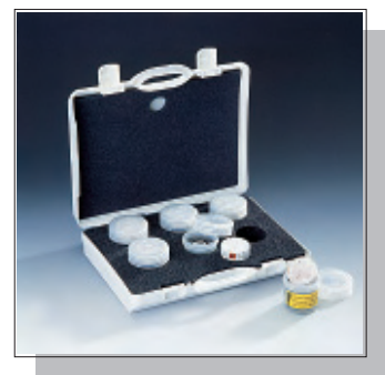
6 x SAL-T-Humidity check set 11%, 33%, 53%, 75%, 90%, 98% RH

Veuillez également consulter les fiches de données de sécurité fournies avec chaque sel.