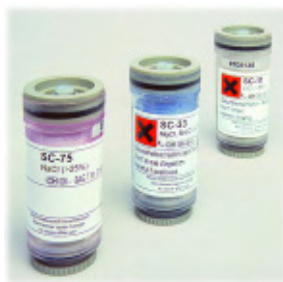
Novasina SC Humidity check for industrial air application.

Tropisches Klima: wir empfehlen, die tiefen Salzwerte in ihren Dosen zusätzlich in einem Dessikator, ev. mit Silicagel zusammen, aufzubewahren.