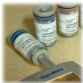
Humidity check on a HygroMate handheld instrument

we recommend to store low humidity salts in their container in a dessicator, perhaps together with silicagel.